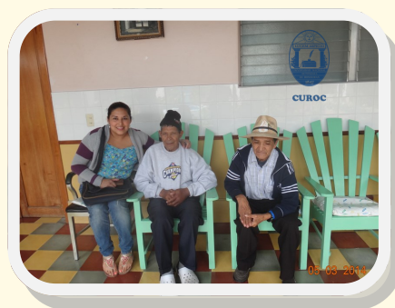
Foto: Estudiante de Enfermería con ancianos del asilo.

De igual manera entregaron los títeres y una maketa del mapa de Honduras como recuerdo de esta bonita actividad.