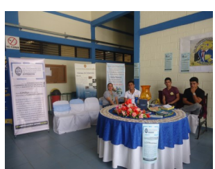
Administración de Empresas