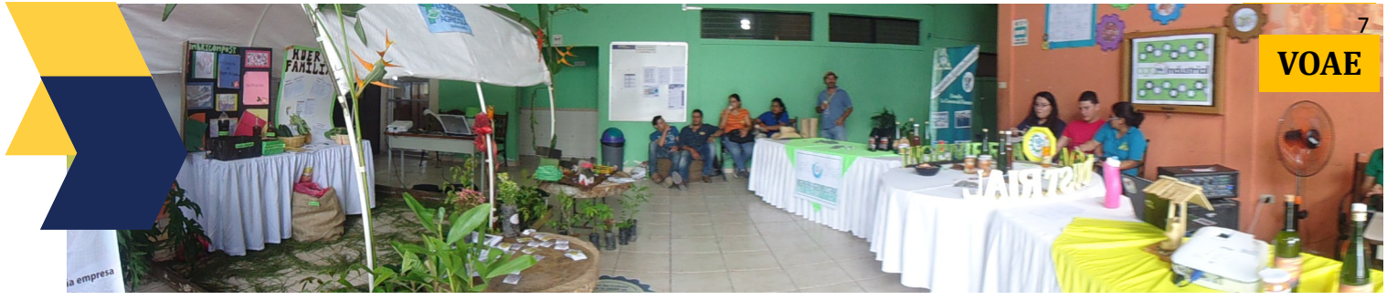
Técnico en producción Agrícola