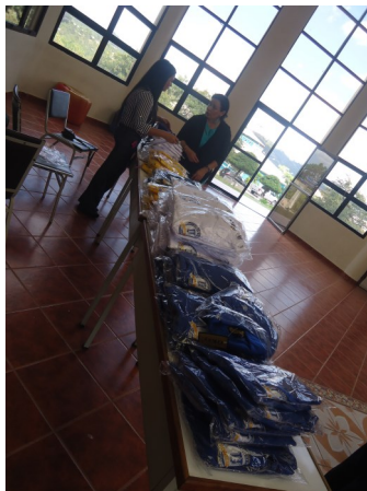
Se vendieron camisetas con el logo ALUMNI UNAH